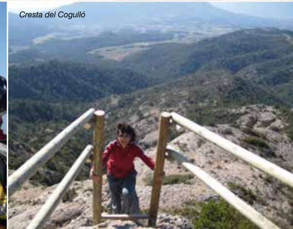
Cresta del Cogulló