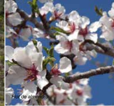
Flor de almendro