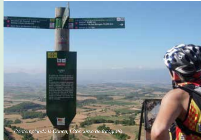
Contemplando la Conca, I Concurso de fotografía