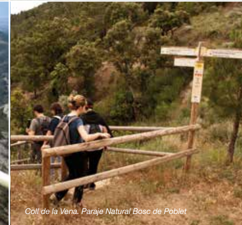
Coll de la Vena. Paraje Natural Bosc de Poblet