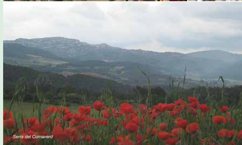
Serra del Comaverd