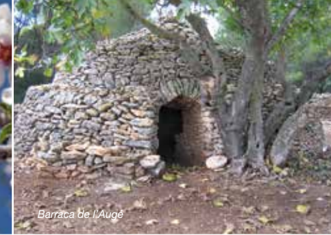
Barraca de l'Augé