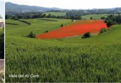
Valle del río Corb