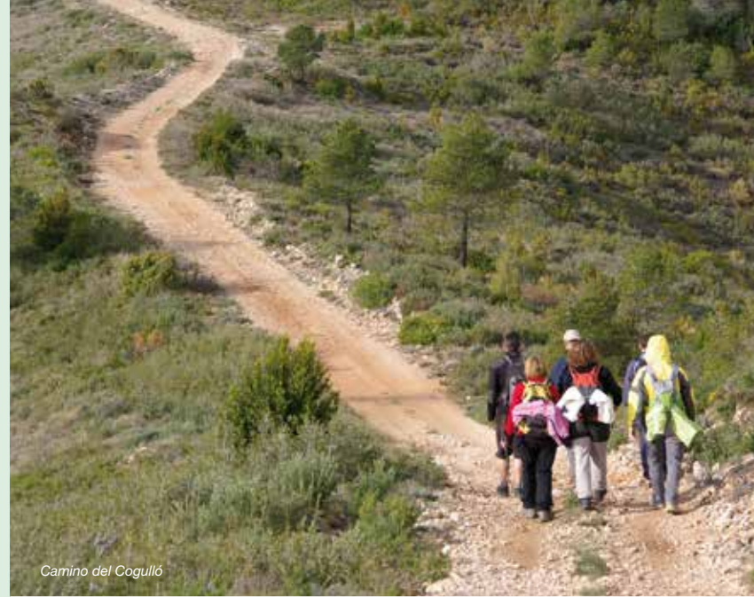
Camino del Cogulló

Y es que el GR 175 La Ruta del Cister , es mucho más que un sendero: es el vínculo que une los tres monasterios de la orden del Cister más relevantes de Cataluña, un paseo por la historia de sus pueblos, el acercamiento a unas tierras modeladas por el hombre en algunos lugares y a una naturaleza salvaje en otros, la cata de una gastronomía auténtica arraigada a la tierra y el contacto con la gente que vive y ama estos paisajes. Es todo aquello que estéis dispuestos a descubrir. Es el GR 175 La Ruta del Cister .