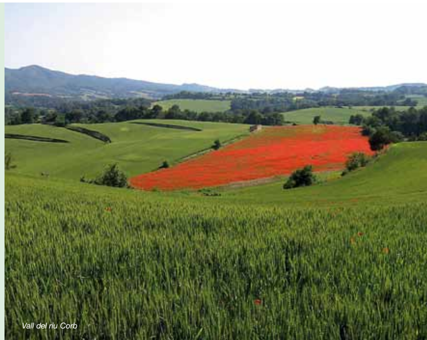
Vall del riu Corb

I és que el GR 175 La Ruta del Cister és molt més que un sender: és el vincle d'unió entre els tres monestirs del cister més rellevants de Catalunya, el fil conductor per la història dels seus pobles, l'aproximació a unes terres modelades per l'home en alguns indrets i a una natura salvatge en d'altres, el tast d'una gastronomia autèntica arrelada a la terra i el contacte amb la gent que hi viu i que estima aquests paisatges. És tot allò que esteu disposats a trobar-hi. És el GR 175 La Ruta del Cister .