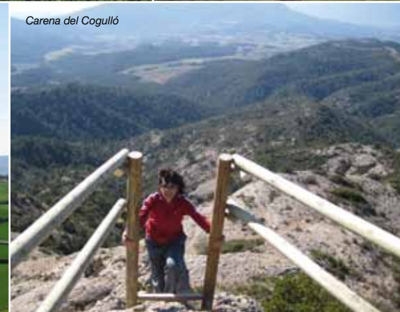
Carena del Cogulló