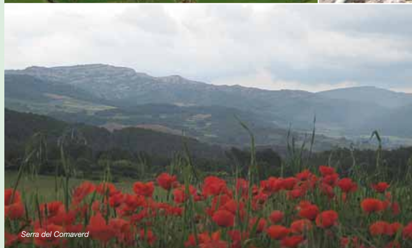
Serra del Comavert