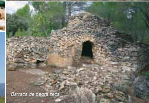
Barraca de pedra seca