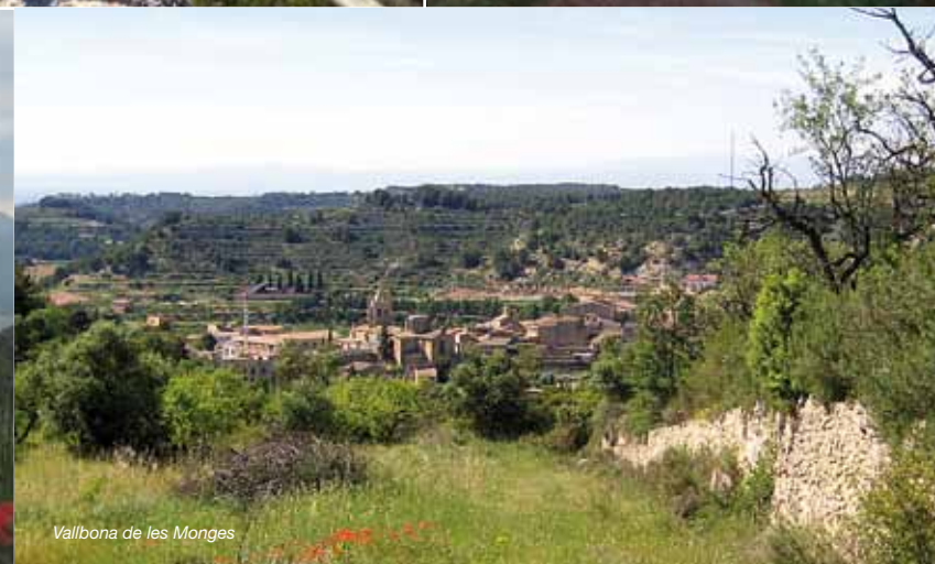
Vallbona de les Monges

This is a circular route with direction notes and timings in either direction you are heading. In addition, its link to other GR (long distance) and PR (short distance) footpaths that criss-cross the Cistercian Route, as well as the wide range of facilities to be found in all the villages along the way make this route ideal for you to complete it on its own on one go, or else to suit your preferences and plan it as part of the many local footpaths in the area.